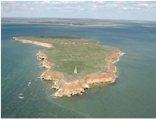
О. Березань, Очаковский район Николаевской области

При изучении сведений из различных источников, в которых содержатся упоминания о культе на Белом острове, любой исследователь сталкивается с одной из древнейших путаниц в его описании, связанной с существованием двух островов в Черном море, на которых ведущим был культ Ахилла: