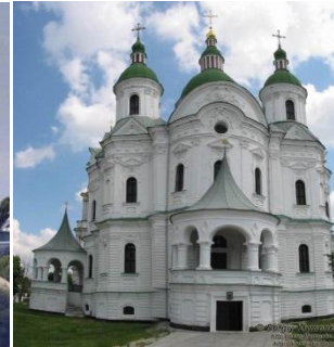
Церковь рождества Богородицы (Козелец)