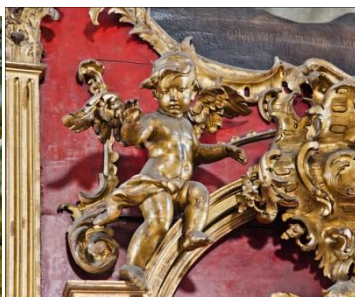
Интерьер Андреевской церкви, Киев

Барокко в музыке сфокусировано на выражении эмоций: отображении буйства чувств, в частности экстаз. В технике исполнения на первый план выходят контрастные формы реализации (среди новаций – ария); в церковной музыке – контрасты солистов, хора и оркестра. Появляются новые инструментальные формы, как-то: вокальные (опера, оратория, кантата, хорал, месса и пр.); жанровые (соната, сюита, fuga, партита, канцона,