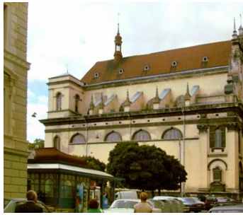
Костел Петра и Павла (Львов)

Шедель; собор Рождества Богородицы (Козелец, 1763), арх. Иван Григорович-Барский и другие многочисленные сооружения преимущественно культового предназначения.