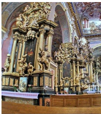
Интерьер собора святого Юра, Львов

Декоративно-прикладное искусство эпохи барокко отличается утяжелением форм и изощренным декором с преимущественно позолоченным оснащением. Стены интерьеров обтягивались тканью с вплетенными золотыми и серебряными нитями, шпалерами с бахромой и кистями. Мебель, как правило, была массивная, стулья – с точеными ножками и высокими спинками, оббивались шкурой и тисненым орнаментом с росписью золотом. Своеобразие декоративно-прикладного искусства эпохи барокко характеризуется объединением изобразительных композиций с большим количеством фигур, декоративной драпировки, пышных бордюров из букетов, фруктов, птиц, изощренностью общей композиции. Его предназначение соответствовало основным вызовам барокковой эстетики – поразить реципиента роскошным оснащением произведения искусства. Этой цели соответствовала помпезная орнаментальность, резкие контрасты, стремление воплотить движение, динамику, движение времени.