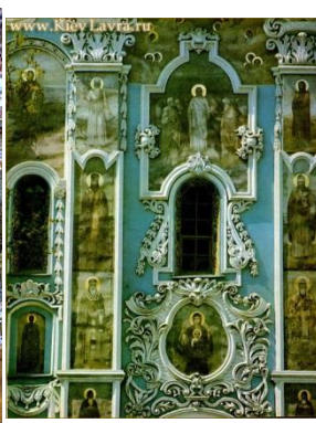
Экстерьер Троицкой Надвратной Церкви, Киев