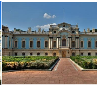
Мариинский дворец (Киев)